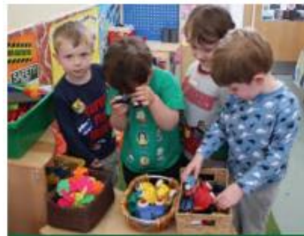
A Places for discovery