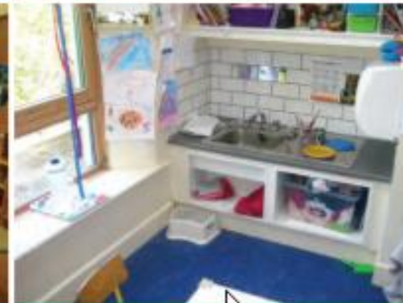
D Somewhere to make a mess