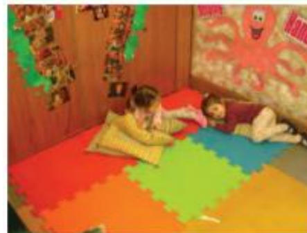
E Places to relax