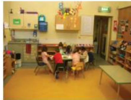
C Places to work together