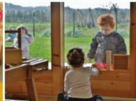
F Easy to go or look outside